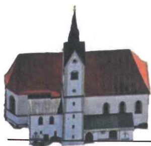
St. Ägidius, Grattersdorf

EINE INFORMATION FÜR DIE GEMEINDE GRATTERSDORF UND UMGEBUNG