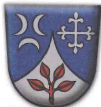
Johannes u. Paulus, Roggersing